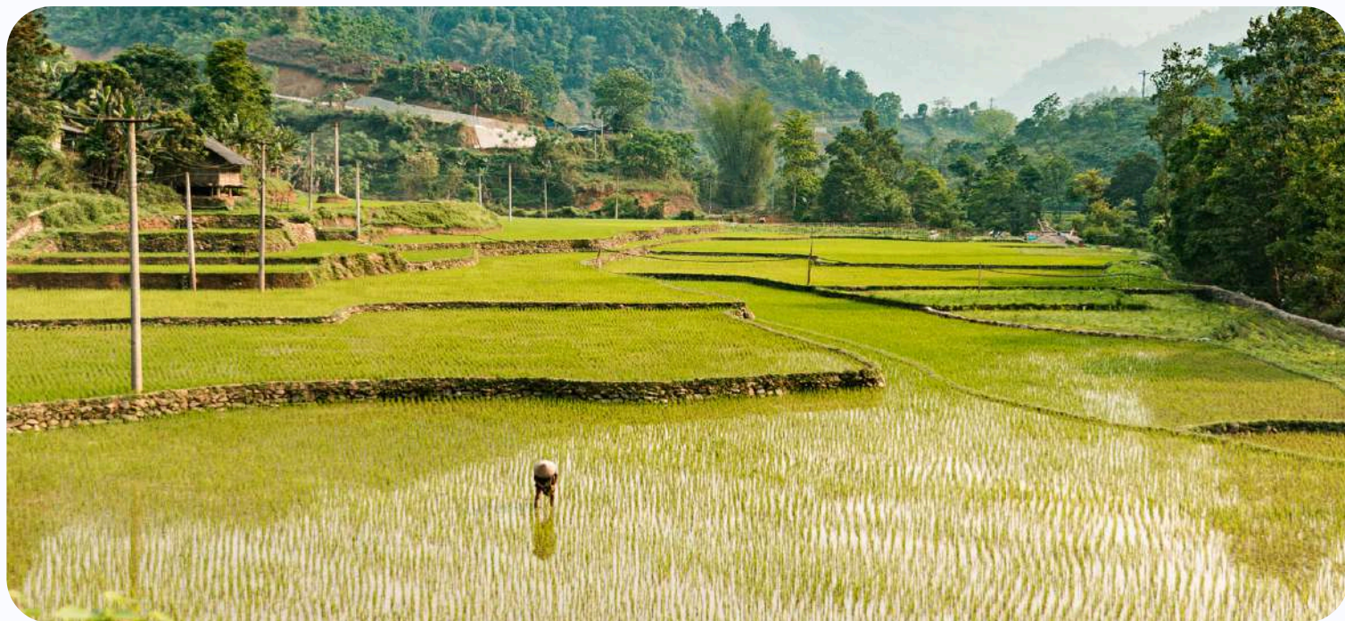
Paysage de Cao Bang à l'extrémité nord du Vietnam

Si vous envisagez des circuits plus personnalisés, avec guide francophone et transport privé , il vous faudra passer par une agence comme la nôtre. En fonction de la saison de votre voyage, il faudra que vous prévoyiez ces excursions plus ou moins à l'avance. Pour les mois de mars, avril, octobre et novembre, le plus tôt est le mieux, c'est-à-dire si possible 6 mois à l'avance . Ceci pour vous assurer les meilleures prestations possibles (notamment pour le guide).