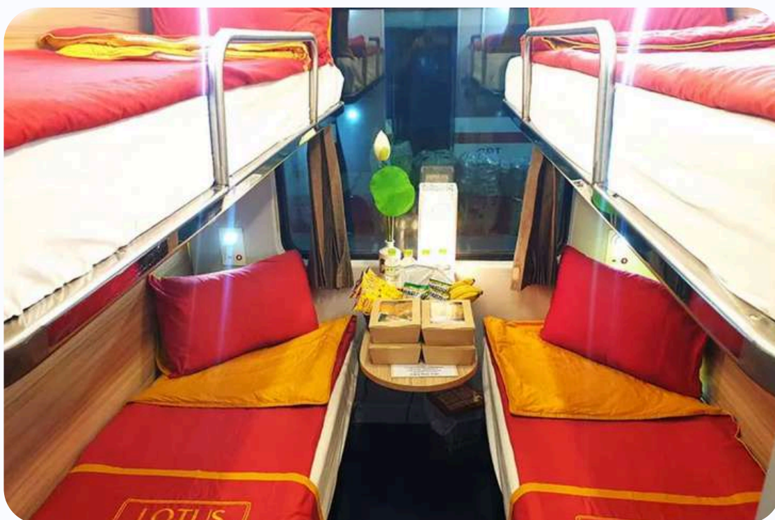
Cabine 4 couchettes dans un wagon de train de la compagnie Lotus

Pour information, le Vietnam se lancera à partir de 2027 dans la construction d'une ligne de chemin de fer à grande vitesse. L'objectif est de la rendre opérationnelle à partir de 2035.