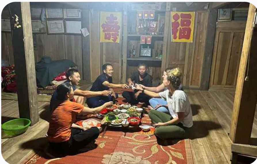
Trinquer chez l'habitant

Par soi-même, il est très difficile de le faire, et il n'existe pas encore de plateforme répertoriant les homestays.