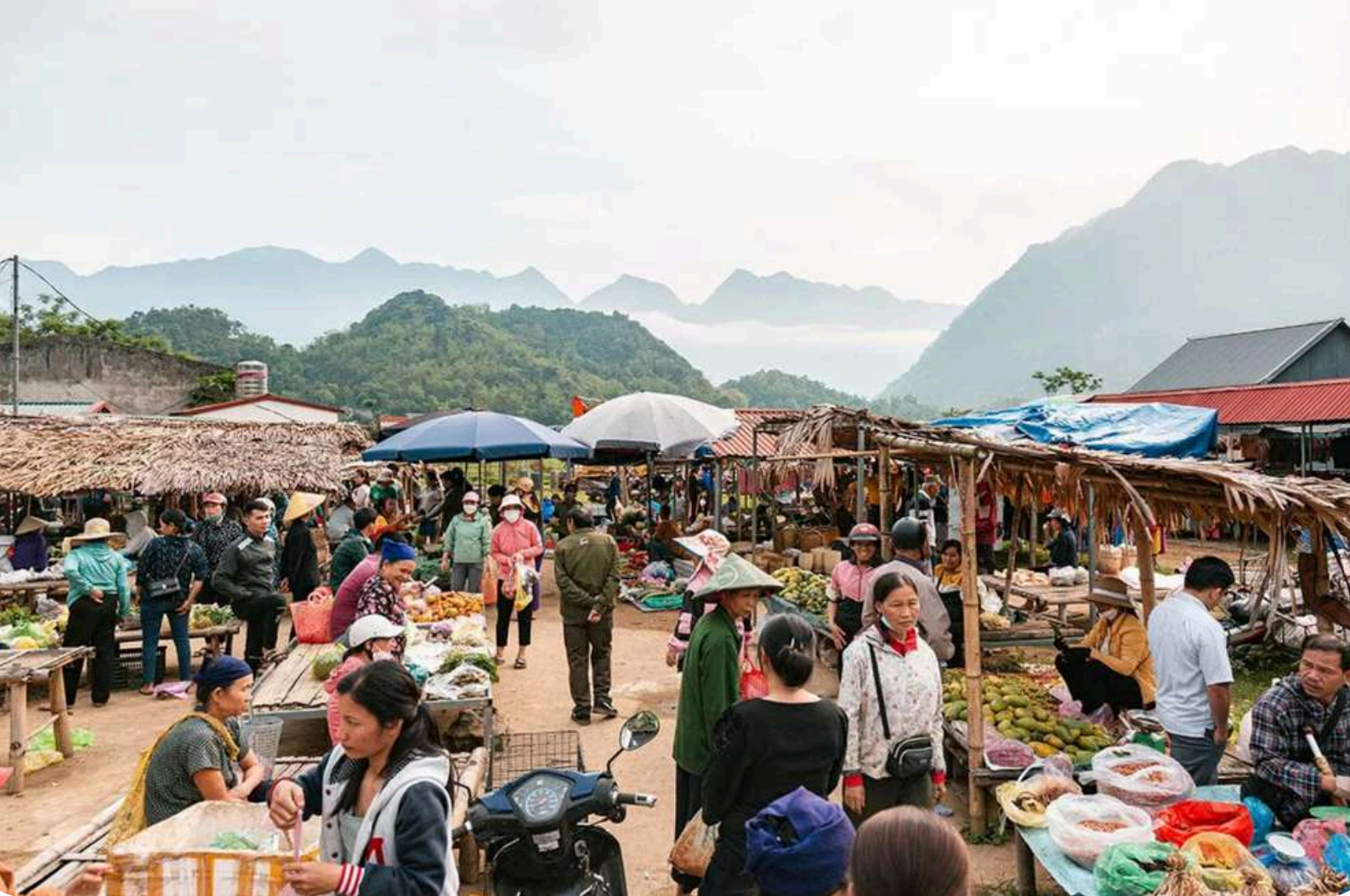
Au marché de Pho Doan à Pu Luong, Nord Vietnam