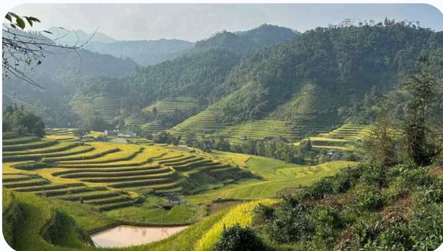
Vue sur les rizières de Hoang Su Phi avant la récolte

Automne (octobre-décembre) : Évitez le centre du pays à cause des fortes pluies et typhons. Le nord offre sa plus belle saison avec un climat doux et ensoleillé. Début octobre, profitez des récoltes de riz à Hoang Su Phi, puis envolez-vous vers le sud pour explorer le delta du Mékong et vous détendre à Phu Quoc.