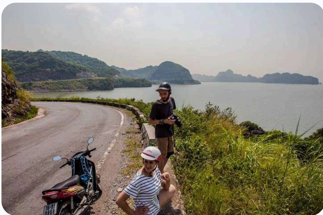
Parfum d'Automne organise une balade en moto avec chauffeurs sur l'île de Cat Ba

En effet, beaucoup de jeunes s'essayent aujourd'hui à la moto au Vietnam, et certains avec malheureusement de terribles conséquences. C'est pourquoi les autorités vietnamiennes ont accentué les contrôles. Il est maintenant obligatoire d'être en possession d'un permis international pour pouvoir louer une moto au Vietnam. En tant qu'agence de voyage soucieuse de la sécurité de nos voyageurs, nous ne conseillons pas la location de motos . Ou alors privilégiez des destinations avec moins de circulation comme l'île de Cat Ba.