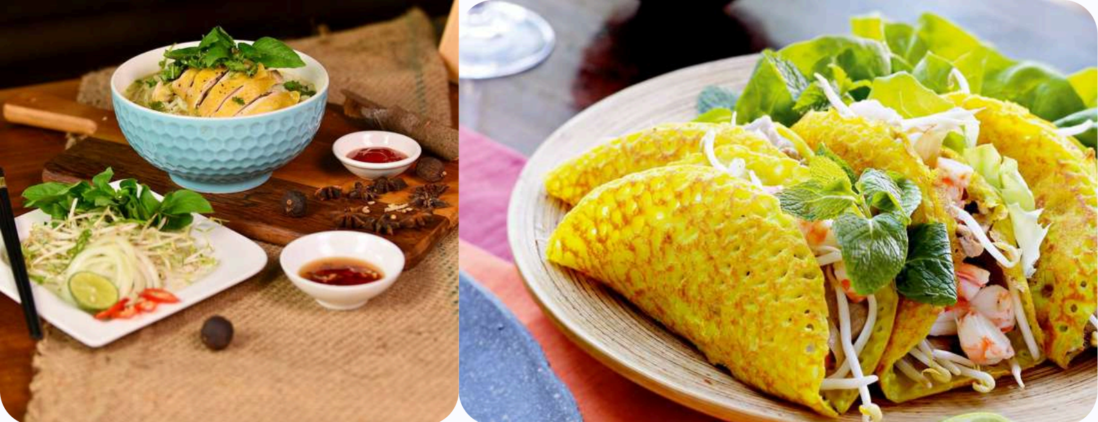
Le pho ga (soupe de poulet) à gauche et le banh xeo (pancake salé) à droite