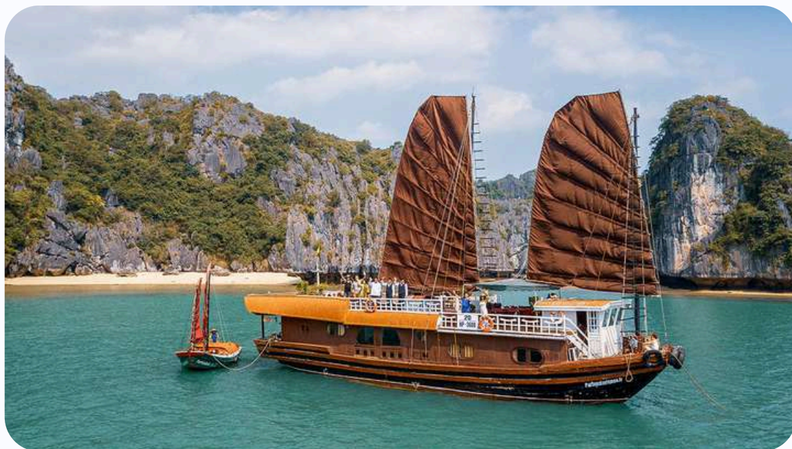
Le bateau Quatre Saisons dans la baie de Lan Ha

Pour avoir un plus large aperçu de notre sélection de bateaux dans les 3 zones de la baie d'Halong, vous pouvez consulter notre page dédiée : Notre sélection de croisières en Baie d'Halong .