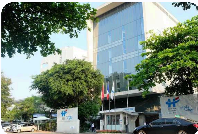
Entrée de l'hôpital français à Hanoi