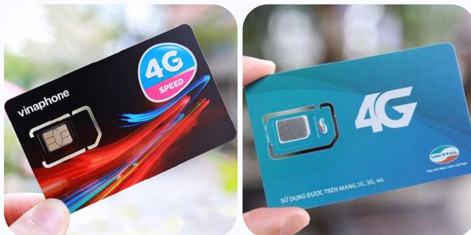
Les deux principaux opérateurs au Vietnam : Vinaphone et Viettel